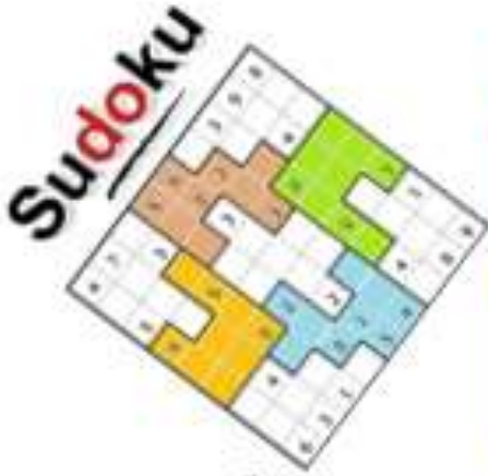
Jeu le Crack