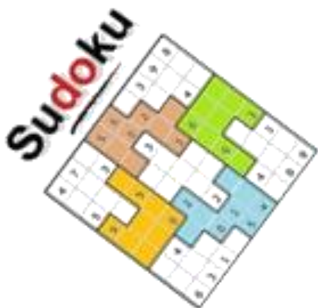
Jeu le Crack

Contacts GSM : 95563444-20556408☆☆☆ Email : atccm@laposte.net ☆☆☆ Site web: competitionmaths.net Page face book: Association Tunisienne de Competitions et de Culture Mathématiques CCB :05502000017546741622. (Banque de Tunisie)